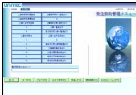
【基幹システムWeb化_受注契約管理メニュー】